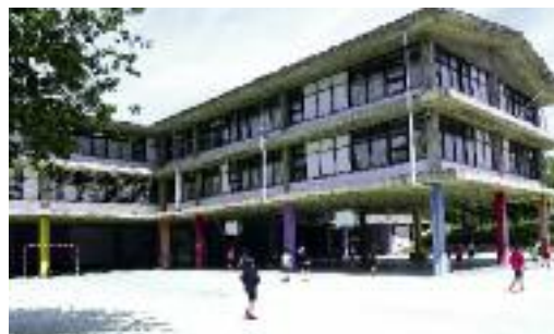
Lehen Hezkuntzako ikasleak hartzeko lekua.