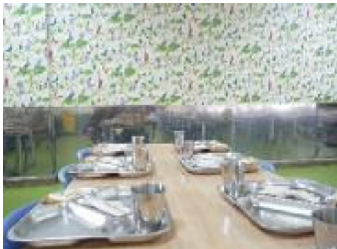
Haur Hezkuntzako jantokia.