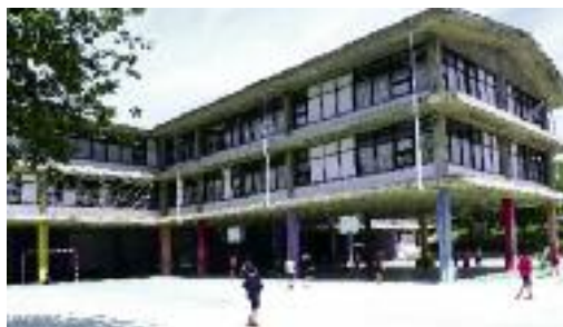
Lehen Hezkuntzako ikasleak hartzeko lekua.