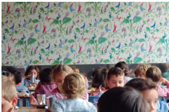
Haur Hezkuntzako jantokia.