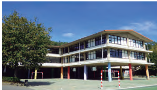
Lehen Hezkuntzako ikasleak hartzeko lekua.

Ohiko ordutegia baino lehen: 16:05ak baino lehen izan behar da, ohiko irteera prozesua hasi baino lehen. Tutorea ida-