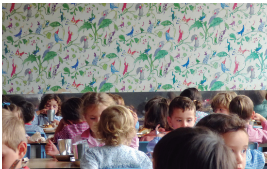
Comedor de Educación Infantil.