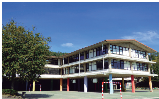
Lugar de recogida del alumnado de Primaria.

Antes de la hora: cuando se deba recoger a un alumno/a antes de la hora habitual, deberá ser antes de las 16:05. Se deberá comunicar por escrito al tutor/a y recoger al alumno/a en secretaría de Primaria.